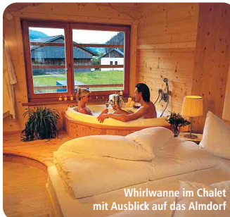
Whirlwanne im Chalet mit Ausblick auf das Almdorf