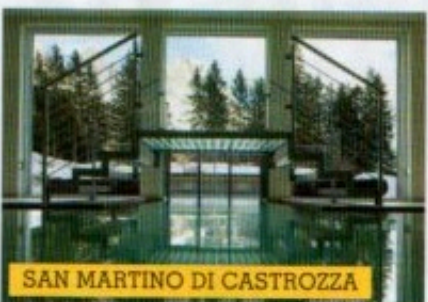
SAN MARTINO DI CASTROZZA

D opo l'autunno anomalo dell'Europa, dal global warming ci aspettiamo di tutto, anche che trasformi il bianco Natale in un beach party . Un recente studio dell'Unione Europea sul clima in 22 stazioni invernali delle Alpi suggerisce a quelle sotto i 1500 metri di cercare alternative allo sci, perché la temperatura è aumentata fino al doppio rispetto a quella globale: entro il 2050 la neve potrebbe non esserci più. Ma niente paura, le neviccate quest'anno ci saranno, anche fino a quote pianeggianti, dice il meteo 2012 della Nasa: ecco 8 idee da qui al disgelo, per ogni montagna, dalla tribù di famiglia in trasferta alla «single-altitudine» perfetta.